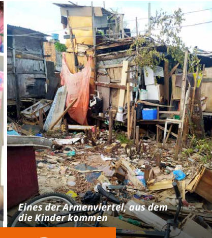
Eines der Armenviertel, aus dem die Kinder kommen

vor den Gefahren der Straße, dürfen spielen und sich kreativ betätigen. Für viele sind das die einzigen Momente, in denen ihnen Spielzeug und Materialien zur Verfügung stehen und sie sich mit Dingen beschäftigen können, die ihnen