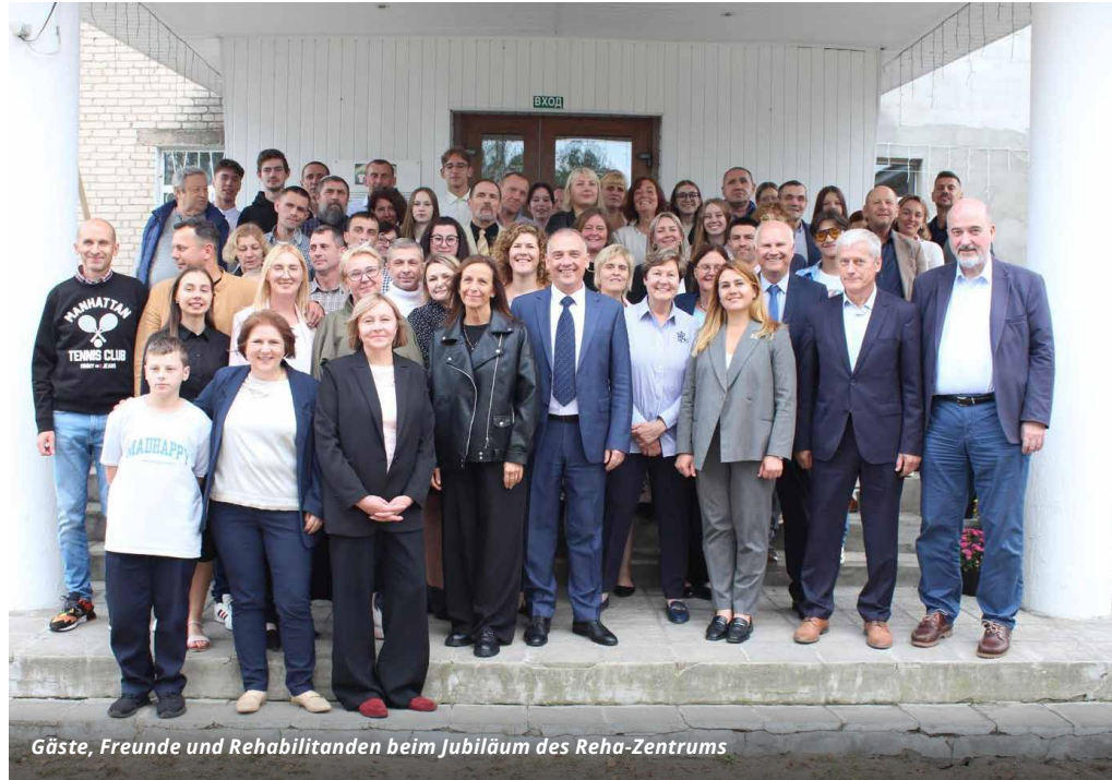
Gäste, Freunde und Rehabilitanden beim Jubiläum des Reha-Zentrums