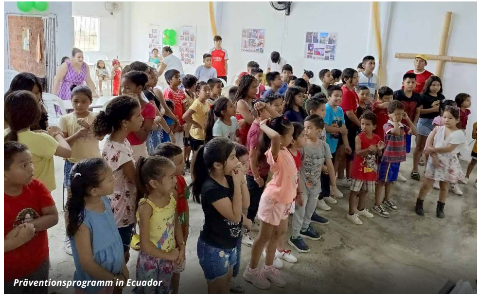
Präventionsprogramm in Ecuador

Seit 2012 führen die TOS Dienste International e.V. in einem Armenviertel in Ecuadors größter Stadt Guayaquil Präventionsprogramme für Kinder und Jugendliche durch. Auch dort sind die Veränderungen im Land zu spüren. Das Team hat Vorsichtsmaßnahmen ergriffen und bietet weiterhin Kreativnachmittage für die Kinder des Viertels Balerio Estacio an. Es kommen mehr denn je.