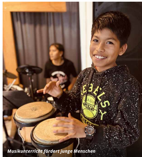
Musikunterricht fördert junge Menschen