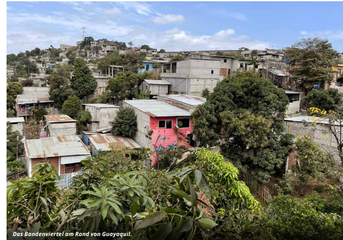
Das Bandenviertel am Rand von Guayaquil.

In dieser Umgebung arbeitet unser Team täglich, um den Kindern und Jugendlichen Alternativen zu Drogenhandel und anderen kriminellen Laufbahnen zu bieten. Sie bewegen sich meisterhaft und umsichtig inmitten dieser Gefahren, um den Menschen vor Ort eine Zukunft mit Perspektive zu eröffnen. Das ist ihr und unser Herzensanliegen. Für mich sind sie die Alltagshelden des Viertels.