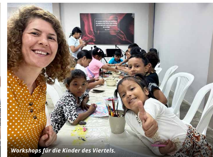
Workshops für die Kinder des Viertels.