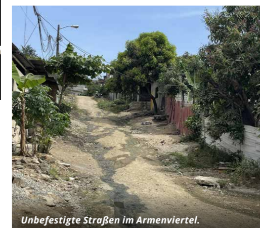
Unbefestigte Straßen im Armenviertel.

Leiterin des Werkes, besucht regelmäßig die Projektstandorte, um die Teams zu ermutigen und sich ein Bild der Lage vor Ort zu verschaffen.