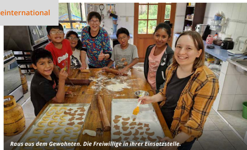
Raus aus dem Gewohnten. Die Freiwillige in ihrer Einsatzstelle.

Folgen Sie uns auf Facebook und Instagram f @tosdiensteinternational