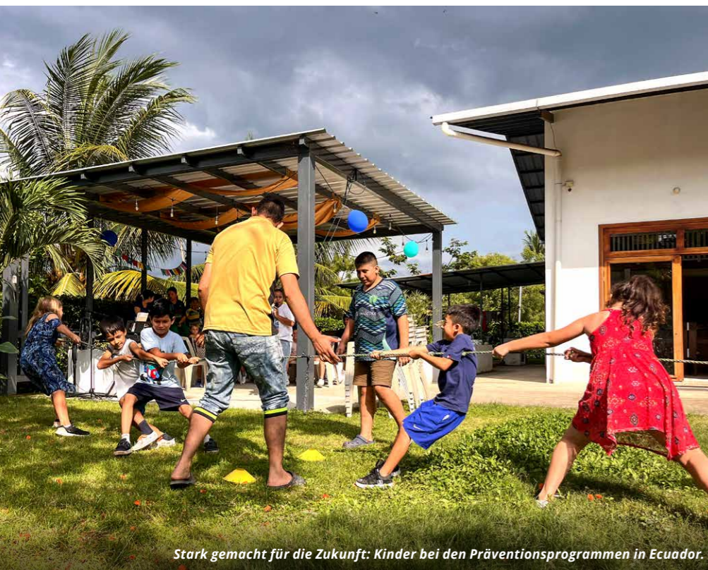
Stark gemacht für die Zukunft: Kinder bei den Präventionsprogrammen in Ecuador.

Krisen, Konflikte, Katastrophen – angesichts dieser Nachrichtenlage denkt sich mancher: „Was kommt noch?“ Die gleiche Frage stand über dem Leben vieler Kinder, die in unseren Transformationshäusern und Präventionsprojekten aufgefangen wurden. Dort investieren die Mitarbeiter ihr Herzblut und ihre Zeit mit der Vision, dass die Kinder dadurch der Liebe Gottes begegnen und verändert werden können.